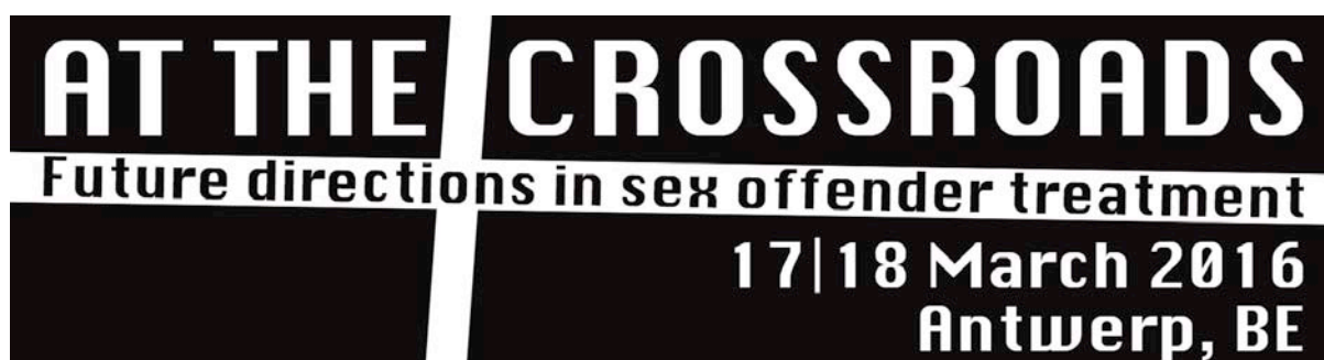
Afbeelding 4 Het logo van het internationale congres 'At the crossroads. Future directions in sex offender treatment'

In 2016 zal NL-ATSA samen met Thomas More University College (Antwerpen, BE) en het Universitair Forensische Centrum (Vlaanderen) een uniek tweedaags internationaal congres organiseren: 'At the crossroads. Future directions in sex offender treatment', op 17-18 maart 2016 in Antwerpen.