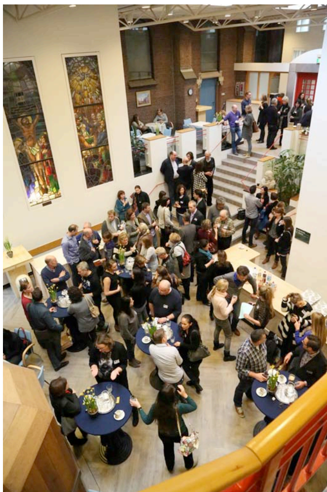
Afbeelding 5 NL-ATSA wil het netwerken tussen Nederlandse en Vlaamse professional stimuleren

NL-ATSA wil haar slagkracht vergroten door het opzetten van compacte werkgroepen bestaande uit actieve leden die zich richten op een specifiek onderwerp/probleem. Denk daarbij bijvoorbeeld aan het creëren van een evidence-based basisplan van aanpak waar gemeenten op kunnen voortbouwen als zij te maken krijgen met uit detentie of behandeling terugkerende pedofielen. Of denk aan het opstellen van richtlijnen voor behandelaars in de reguliere GGZ die een zedendelinquent in behandeling krijgen voor niet-risico gerelateerde problematiek. Onderwerpen en activiteiten van de werkgroepen worden op deze plek te zijner tijd bekendgemaakt. Wanneer u wilt deelnemen aan een bestaande werkgroep, kunt u zich aanmelden via het dan beschikbare aanmeldingsformulier.